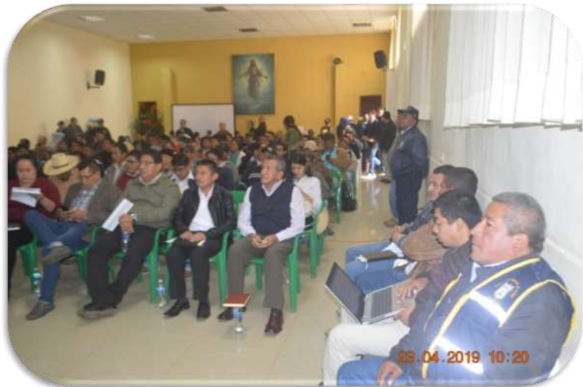
PUBLICO PRESENTE A LA I AUDIENCIA PÚBLICA DE SEGURIDAD CIUDADANA