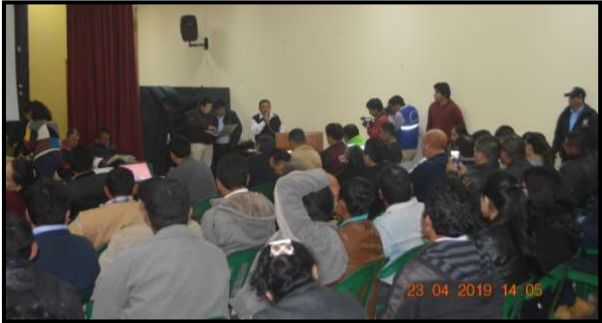
EXPOSICION DEL SEÑOR ALCALDE Y PRESIDENTE DEL COMITÉ PROVINCIAL Y DISTRITAL DE SEGURIDAD CIUDADANA HACIENDO LLEGAR SU SALUDO A LOS PRESENTES A LA I AUDIENCIA PÚBLICA DE SEGURIDAD CIUDADANA